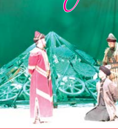
УШБУ МАТЕРИАЛНИ ЛОТИН ЁЗУВИГА АСОСЛАНГАН ЎЗБЕК АЛИФБАСИДА ҲИШ УЧУН МАЗКУР QR-КОДНИ СКАНЕР ҚИЛИНГ.

— Нодирабегим шоира бўлиш билан бирга, аввало, она. Шунингдек, ўзбек давлатчилиги бошқарувида давлат арбоби сифатида гавдаланади. Томошабиннинг