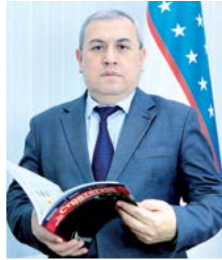
Анвар ТўЛАГАНОВ, Ўзбекистон Республикаси Президенти ҳузуридаги Статистика агентлиги бошқарма бошлиғи ўринбосари

Хар қандай соҳада бўлгани каби статистикада ҳам сифатни таъминлаш белги-ланган маълум мезон ва қоидаларга риоя этиши, барча босқич ва жараёнларни аниқ режалаштириш ва тизимли амалга ошириши, зарур молиявий, технологик ва бошқа ресурсларни жалб этиши, мавжуд тизим ва воситаларни мунтазам янгиллаб, такомиллаштириб бориши тақозо этади. Тизим фаолиятини ташкил этишни самарадорлиги эса соҳага халқаро даражада тавсия этилган илгор моделлар ва тизимларни кенг жорий этилиши билан чамбарчас боғлиқ.