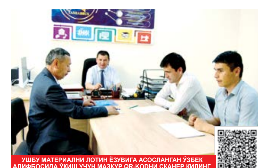
УШБУ МАТЕРИАЛНИ ЛОТИН ЁЗУВИГА АСОСЛАНГАН ЎЗБЕК АЛИФОСИДА ҲАМ ҚИЗИҚАРЛИК УЧУН МАЗКУР QR-КОДНИ СКАНЕР ҚИЛИНГ.

Талабаларнинг соғлом турмуш тарзига риоя этиши учун шaroит яратиш, шунингдек, маънавий-маърифий ва тарбиявий ишлар тизimini такомиллаштириш борасида