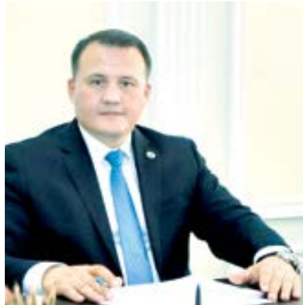
Ахтам ҲАЙТОВ, Олий Мажлис Қонунчилик палатаси Спикери ўринбосари, ЎзЛиДеП фракцияси раҳбари