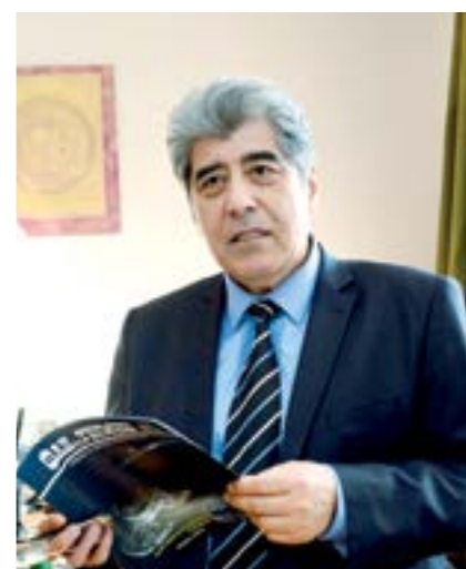
Шухрат ЭГАМБЕРДИЕВ, Астрономия институти директори, академик