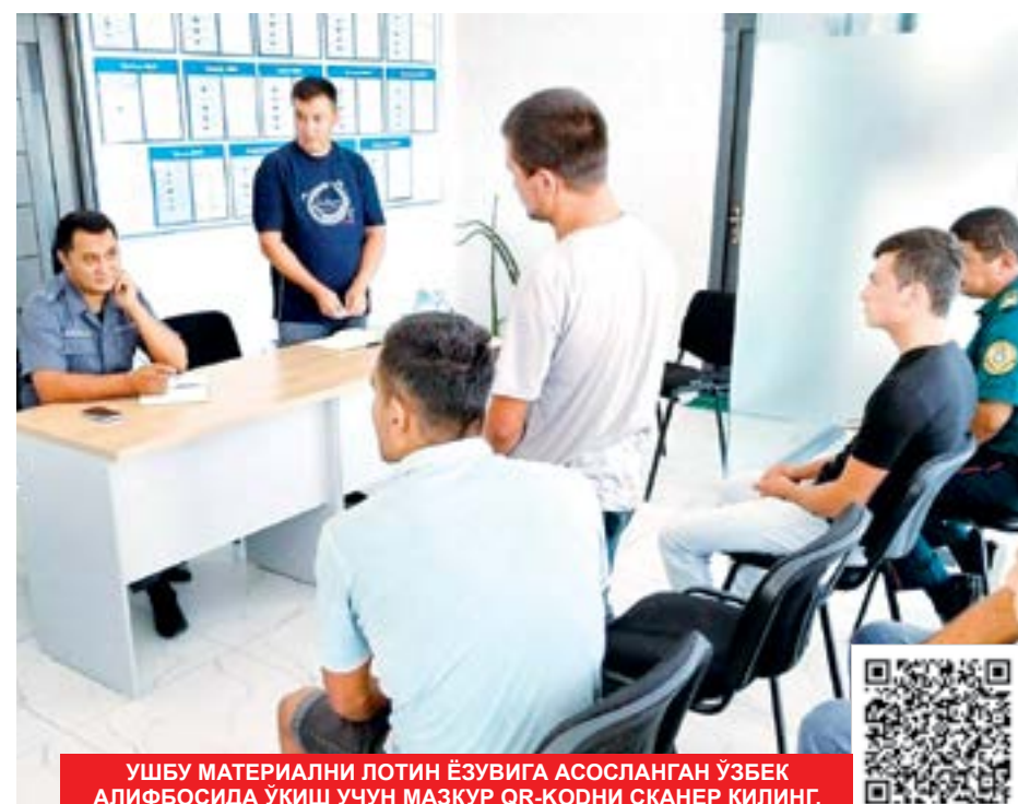
УШБУ МАТЕРИАЛНИ ЛОТИН ЁЗУВИГА АСОСЛАНГАН ЎЗБЕК АЛИФБОСИДА УҚИШ УЧУН МАЪМУР QR-KODНИ СКАНЕР ҚИЛИНГ.

Агар соҳалар кесимида таҳлил қилсак, мурожаатларнинг энг кўпи моддий ёрдам, газ, электр, сув, иссиқлик таъминоти, уй-жой, ер, иш билан таъминлаш, соғлиқни сақлаш, маҳалланинг ички йўллари таъмирлаш, кредит олиш масалаларида бўлди.