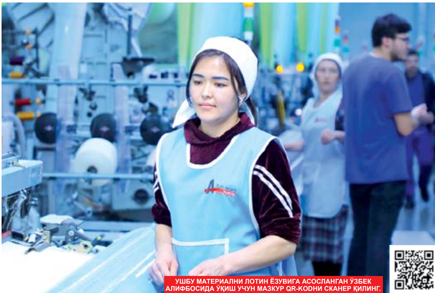
УШБУ МАТЕРИАЛНИ ЛОТИН ЁЗУВИГА АСОСЛАНГАН ЎЗБЕК АЛИФБОСИДА УҚИШ УЧУН МАЗКУР QR-КОДНИ СКАНЕР ҚИЛИНГ.