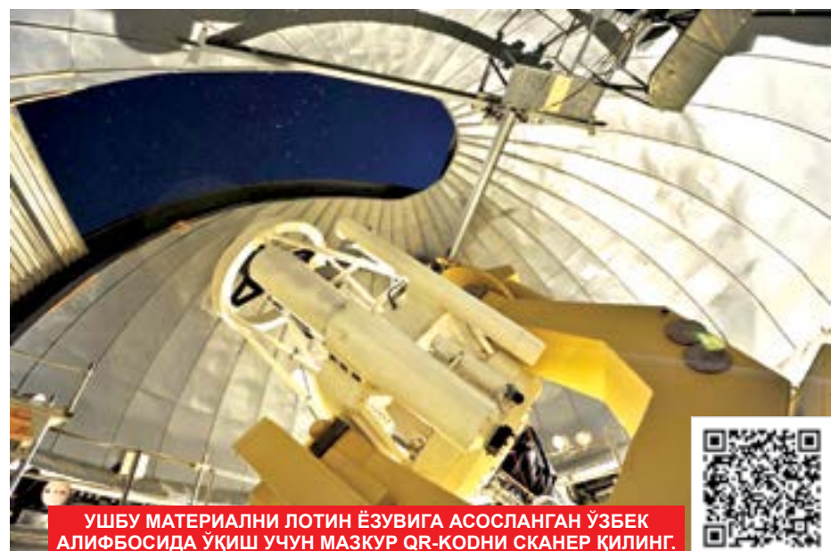
УШБУ МАТЕРИАЛНИ ЛОТИН ЁЗУВИГА АСОСЛАНГАН ЎЗБЕК АЛИФОСИДА ҲАМ ҚИЗИҚАРЛИК УЧУН МАЗКУР QR-КОДНИ СКАНЕР ҚИЛИНГ.

Бу даврда Зомин туманида туризмин ривожлантириш ишлари қизиган авж олди. “Зомин” туристик-рекреацион зонаси ташкил этилди. Аслида бу иккала иншоот муайян шартларни бажариб, келиши иш курсига бир-бирига фойда келтириши мумкин. Радиообсерватория яқинида туристик объект бўлиши қатор афзалликлар яратади: юқори сифатли йўллар, электр ва сув таъминоти ва ҳоказо. Лекин радиообсерваторияга радиообсерватория манбаларини яқин жойлаштириб, қузатувларга халал берилмаслиги керак. Радиообсерватория ишга тушгач, Зоминга кўплаб сайёҳларнинг жалб қилишга асқотиши мумкин. Бундай ҳамкорлик жаҳон таъриҳида жуда кўп учрайди. Биргина мисол: бир неча йил олдин Хитойнинг жануби-ғарбидagi Пингтан ўлкасида кўзгусининг диаметри 500 метр бўлган жаҳондаги энг йирик FAST радиотелескопи ишга